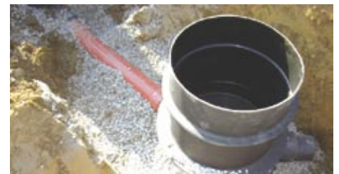
Gussabdeckung Klasse A15, B125 u. D400 mit Betonausgleichsring mit Z-Falz