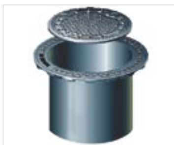
Teleskopadapter auch im Schachtsystem K 1000 Standard einsetzbar!