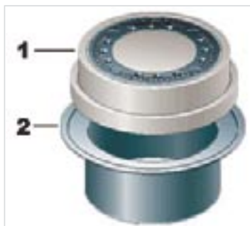
Teleskopadapter auch im Schachtsystem K 1000 GT einsetzbar!